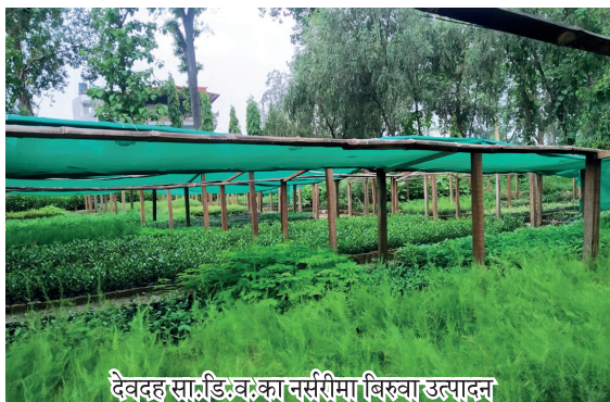
देवदह सा.डि.व.का नर्सरीमा बिरुवा उत्पादन