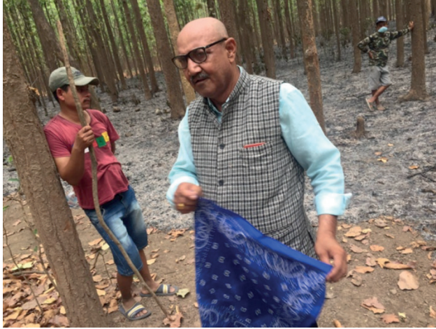
वन डढेलो निभाउदै कर्मचारी र सा.व.उ.स