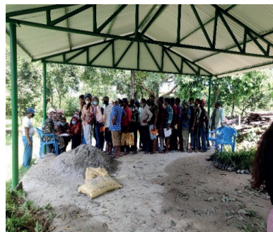
फलफुलका बिरुवाहरू वितरणको क्रममा