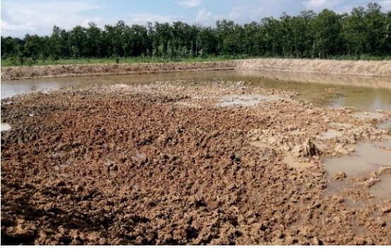
चारपाला सा.व मा निर्माण गरिएको पोखरी