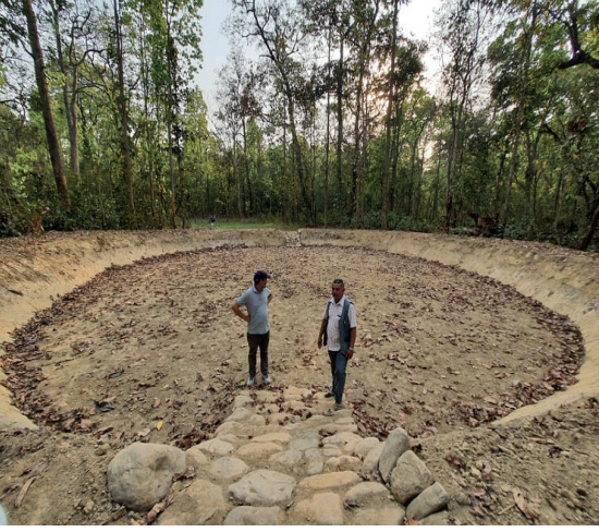
रोहिणी सा व मा पोखरी निर्माण