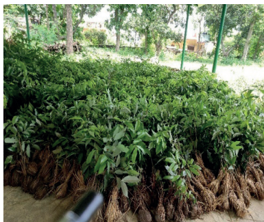
वितरण गर्न ल्याइएको आप, लिच्ची, कागती, अम्बा, रुद्रराक्ष, एभोकाडो को बिरुवाहरू