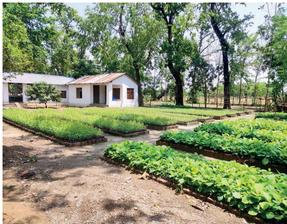
लुम्बिनी सव.डि.व.का, मा रहेको वन नर्सरी