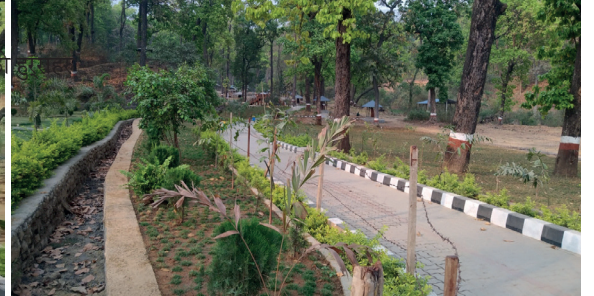
पदमार्ग निर्माण कार्य देवदह न.पा ६