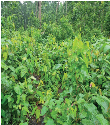
लुम्बिनी साभेदारी वनमा पुनरुत्पादन