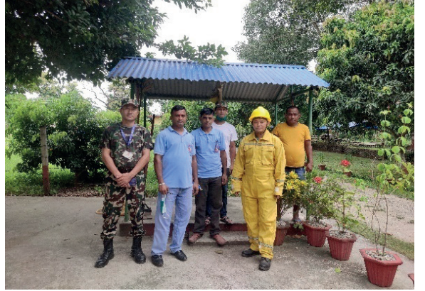
कार्यालयमा खरिद भएको अग्नि नियन्त्रक सामाग्री