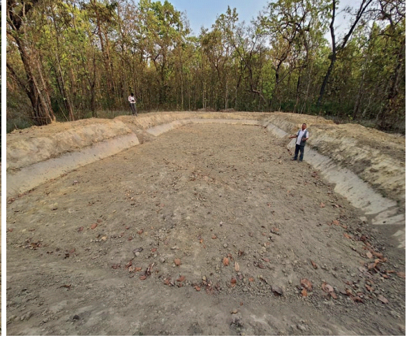
गडहवा ४ ठकुरापुरमा सिमसार संरक्षण पोखरी निर्माण