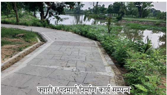
क्याारी र पदमार्गी निर्माण कार्य सम्पन्न