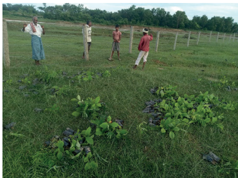
ठकुरापुर क्षेत्रमा गरिएको वृक्षारोपण