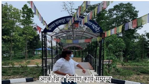
आर्क ब्रिज निर्माण कार्य सम्पन्न