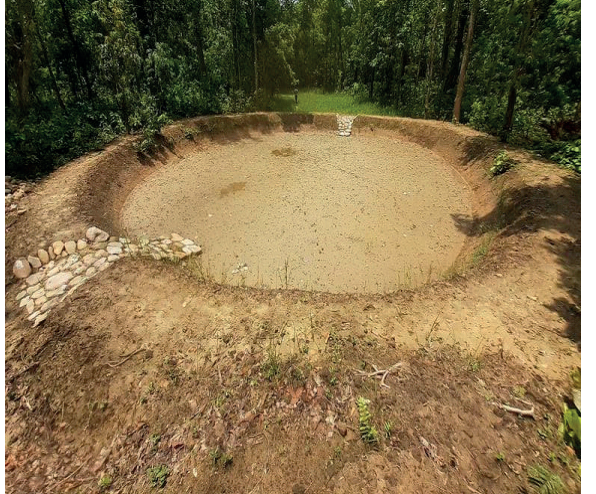
रचना सा.व.उ.स मा संरक्षण पोखरी निर्माण