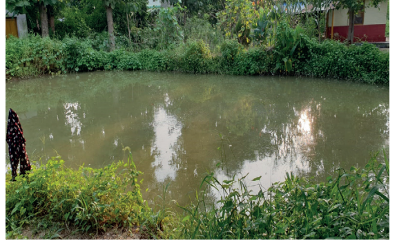
डि व का मा निर्माण भएको संरक्षण पोखरी