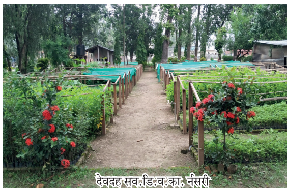
देवदह सव.डि.व.का नर्सरी