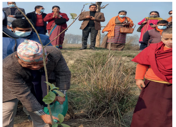
विश्व सिमसार दिशका भलकहरु