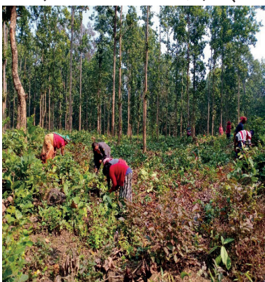
देवदह साभेदारी वनमा गरिएको भाडि सफाई