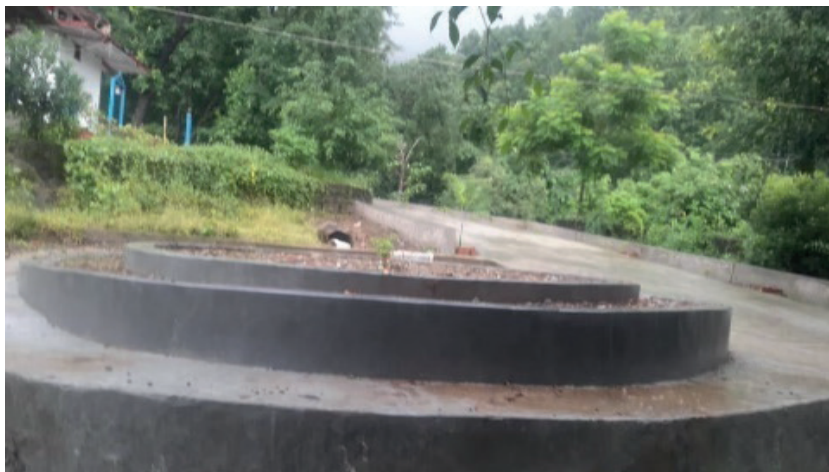
लक्ष्मी आर्दश सा.व मा निर्माणा गरिएको फुलको क्यारी, बाटो स्तारउन्नती