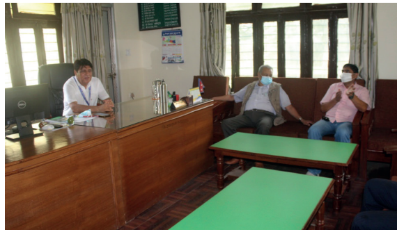
जिल्ला वन समन्वय समितिको बैठक पश्चात नर्सरी अवलोकन