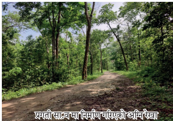
प्रगती साक्षव मा निर्माण गरिएको अग्निरेखा