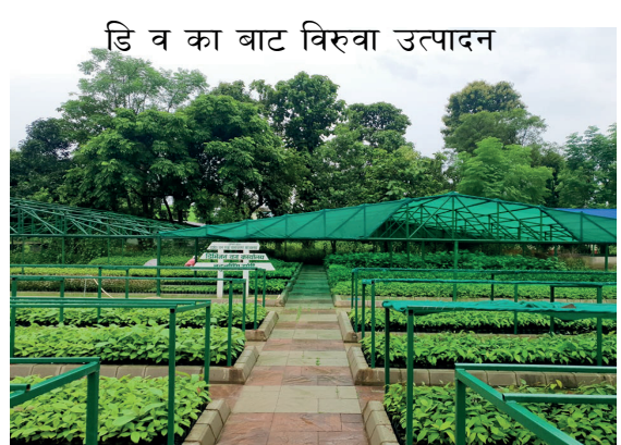
डि व का बाट विरुवा उत्पादन