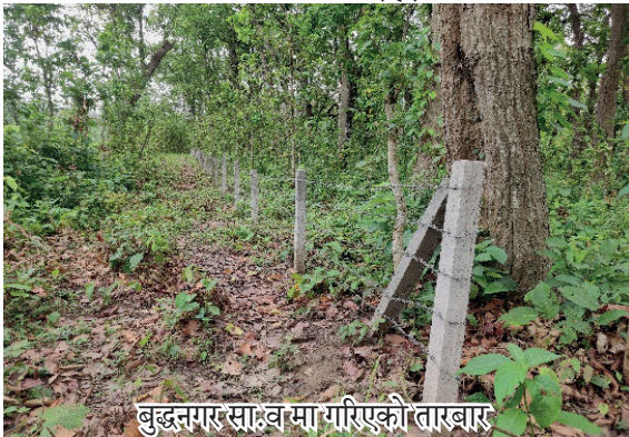
बुद्धनगर साक्षव मा गरिएको तारबारा