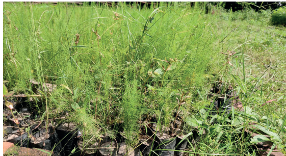
डि.व.का नर्सरीमा उत्पादन भएको कुरिलोको बिरुवा