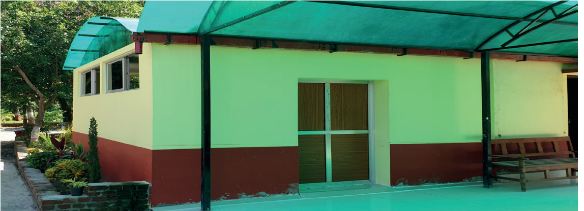
जडिबुटी भण्डारण गृह