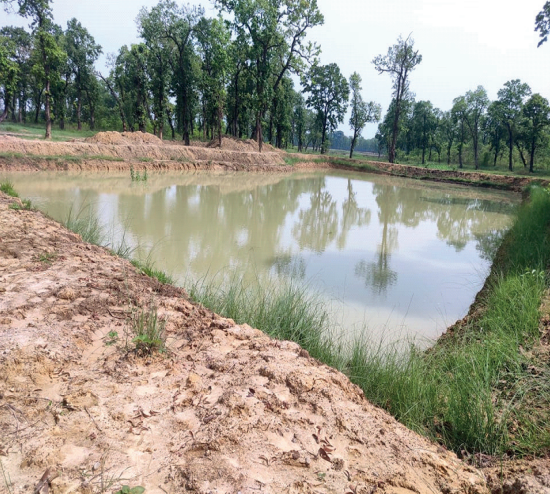
रोहिणी सा.व.उ.स मा सिमसार संरक्षण पोखरी