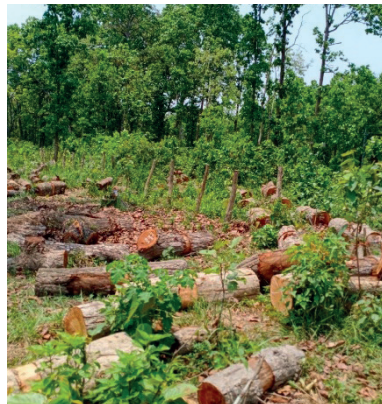
ढलपडा वनको उत्पादन भएको काठ दाउरा